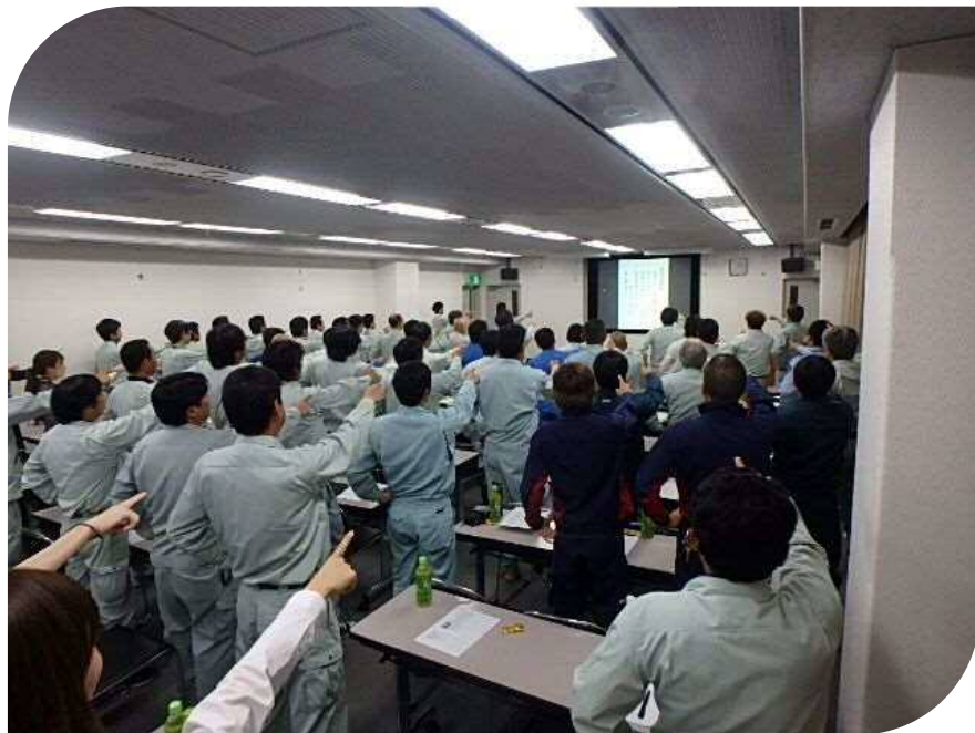
安全五原則・年間安全標語 「指差唱和」